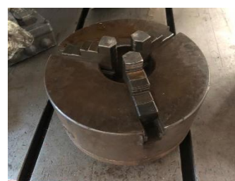
280/V176 Plato universal 3 garras ext - int. Ø 270 mm. Precio 500 €