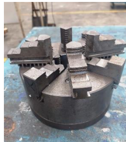
280/V196. Plato universal con contraplato Ø 200 mm. 4 garras int+ext. Precio 400 €