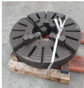
280/V194 Plato 4 garras indep Ø 700 mm. Precio 1400 €