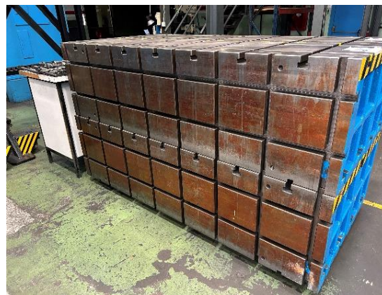
Ref. 280/TMV18. 2 juegos de 2 paralelas 2200x500x600mm c/una