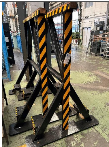
Ref. 280/MTV16. 2 caballetes de gran pesaje con ruedas bloqueantes.