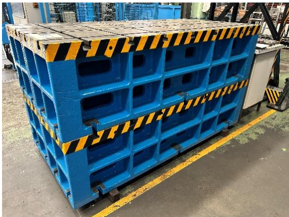
Ref. 280/TMV17. 2 juegos de 2 paralelas 2200x500x600 mm.c/una