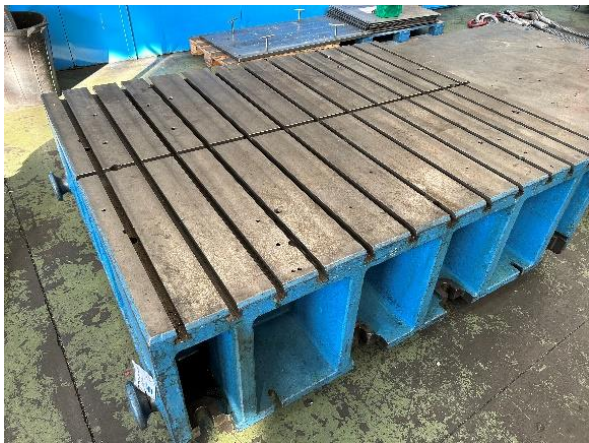
Ref. 280/TMV15. Mesa ranuras con 15 ranuras en T. Dimensiones 1800x1500x560mm