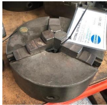
280/V011 Plato BISON universal de 3 garras Ø 210 mm. Precio: 400 €