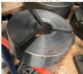
280/V173 Plato universal 3 garras Ø 250 mm (SIN GARRAS) Precio 300 €