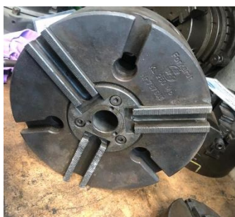
280/V179 Plato neumático FORKARDT 3 garras Ø 250 mm.