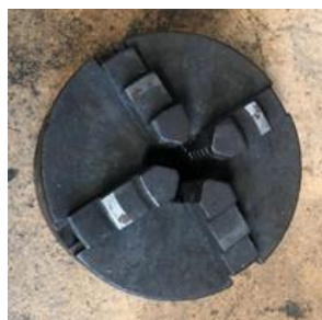
280/V181 Plato 4 garras Ø 110 mm. Precio 180 €