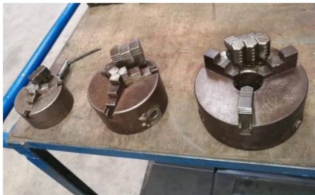
280/V097 Plato 3 garras (int + ext) Ø 130 mm. Precio: 165 € 280/V098 Plato 3 garras (int + ext) Ø 110 mm. Precio: 150 € 280/V099 Plato 3 garras (int + ext) Ø 80 mm. Precio: 115 €