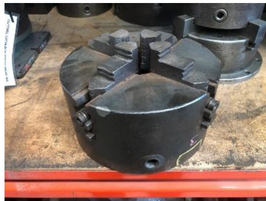
280/V010 Plato torno 4 garras TdeG Ø 220 mm. Precio 450 €