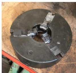
280/V174 Plato universal 3 garras Ø 250 mm. Precio 400 €