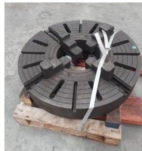
280/V194 Plato 4 garras independientes Ø 700 mm. Precio 1400 €