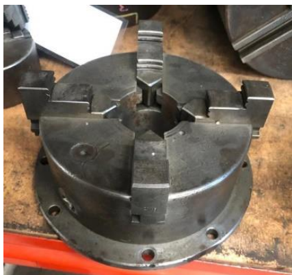
280/V082 Plato universal 4 garras TdeG Ø 190 mm. Precio 350 €

Ref. 280/ V082-V097-V098- V099-V010-V011