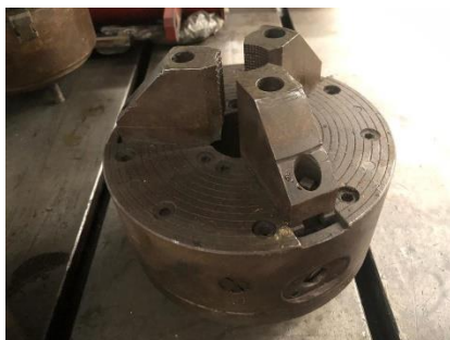
280/V177 Plato universal 3 garras Ø 240 mm. Precio 300 €