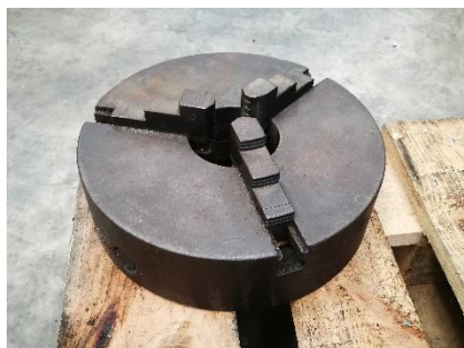
280/V163 Plato universal 3 garras ext. TdeG Ø 265 mm. Precio 500 €

Ref. 280/ V163-V164- V173 V174-V175-V176