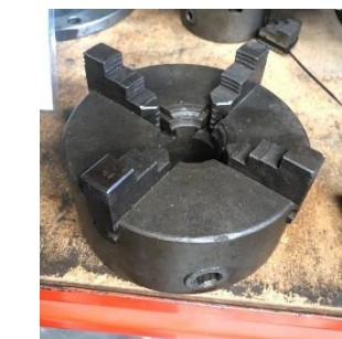
280/V180 Plato 4 garras Ø 130 mm. Precio 195 €