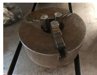
280/V176 Plato universal 3 garras ext - int. Ø 270 mm. Precio 500 €