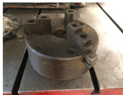
280/V175 Plato universal 3 garras Ext -int Ø 255 mm. Precio 500 €