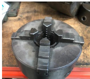
280/V178 Plato 4 garras Ø 160 mm. Precio 210 €